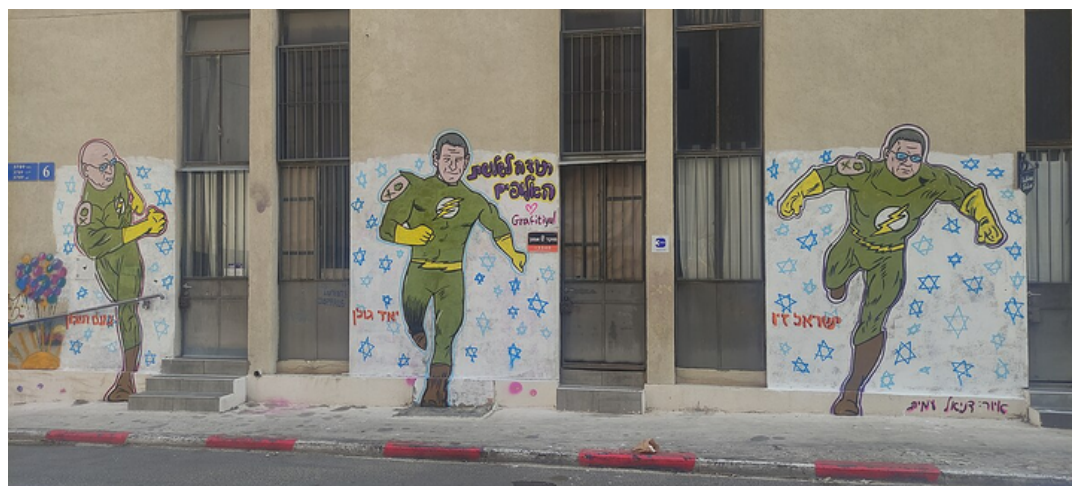
Noam Tibon, Yair Golan, Israel Ziv