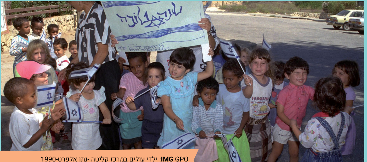
IMG GPO: ילדי עולים במרכז קליטה-נתן אלפרט-1990

לצייר ציור עם צבע אחד יכול להיות דבר מאוד יפה.