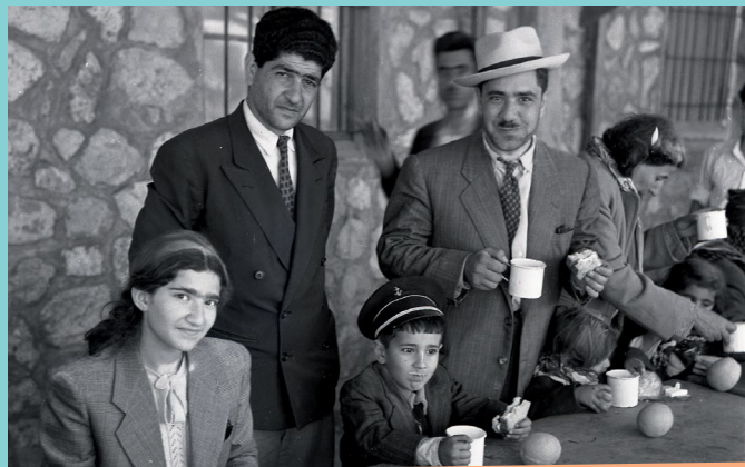
1951 : עולים יהודים מעירק- ארכיון בנו רוזנברג Benno Rothenberg /Meitar Collection / National Library of Israel The Pritzker Family National Photography Collection / CC BY 4.0

עוד מבצע בשנות החמישים, להעלאת יהודי עיראק, קבלה את השם המיוחד "עליית עזרא ונחמיה" על שמם של שני המנהיגים מתקופת המקרא, הגיעו עם העולים מבבל (זו עיראק של ימינו).