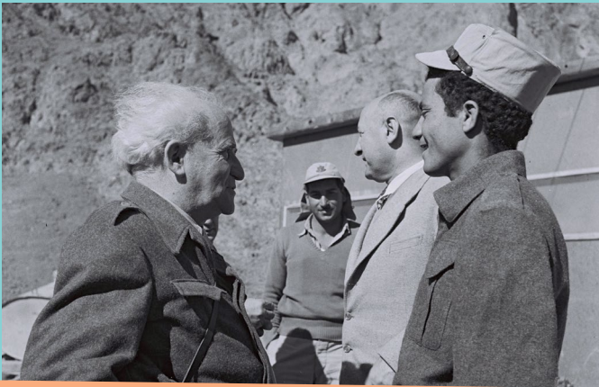
דוד בן גוריון עם חיל שעלה מתימן- - 1949

עד היום אחד מהערכים המובילים בצה"ל, הוא קיבוץ הגלויות ושילובם של יהודים מכל רחבי העולם שמגיעים לתרום את חלקם בהגנה על המולדת.