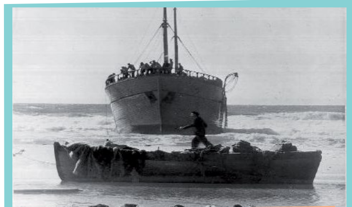
1947 : אניית המעפילים סוזנה

גם אחרי שהוקמה מדינת ישראל, המשיכו היהודים לעלות מכל רחבי העולם, והיו אפילו כמה מבצעים מיוחדים ונועזים של ממשלת ישראל להעלות יהודים ממדינות עוינות.