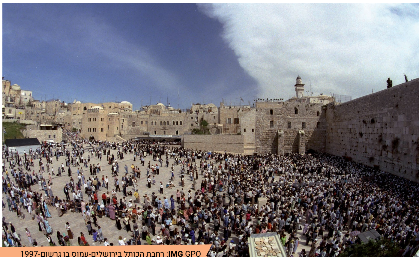
רחבת הכותל בירושלים-עמוס בן גרשום-1997: IMG GPO

ובגלל שירושלים קדושה יותר מכל המקומות בעולם, אנו משתמשים במושג "לעלות לירושלים" ולכן, מי שעלה לירושלים בשלושת הרגלים, נקרא "עולה רגל".