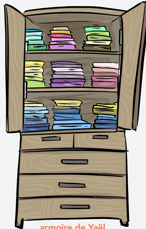
armoires de Yaël