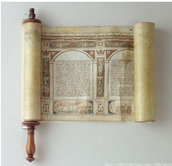
Document 2 : Meguila italienne du 18e siècle.