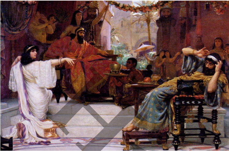
Document 7: Esther (1888) par Ernest Normand