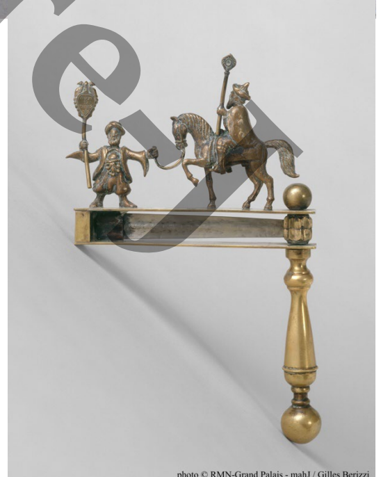
Document 12 : Crécelle de Pourim (19 e siècle).

« Le Rabbini italien du 13 ème siècle, Tzidkiyahu ben Avraham, cite au nom de Rashi l'usage selon lequel il faudrait taper avec ses pieds ou pierre contre pierre, ou encore casser du bois, lorsque l'on récite les noms d'Aman ou Zeresh, vraisemblablement pour éviter de les entendre. Il existe toutefois un autre usage qui aurait pour but d'effacer le nom d'Aman : celui d'écrire son nom sur deux pierres et de les taper l'une contre l'autre dès que l'on lit son nom, même pendant la lecture synagogale de la Meguila. Cet usage est rapporté par Rav Avraham de Lunel, par Rav David Aboudraham, par Rav Aharon HaCohen de Lunel, puis par le Rav Yossef Karo et le Rema. » (source : https://www.cheela.org/84207/la-foire-aux-questions-de-pourim )