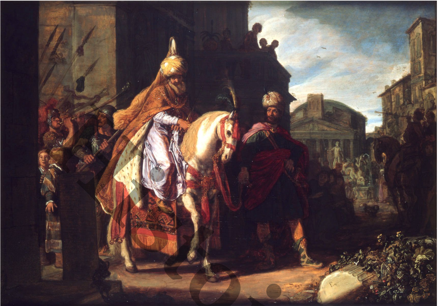
Document 6 : Le triomphe de Mardoché (1624) par Pieter Lastman