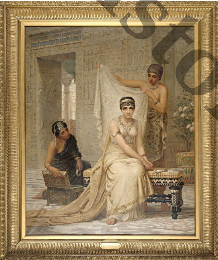
Document 9 : Reine Esther (1878) par Edwin Long