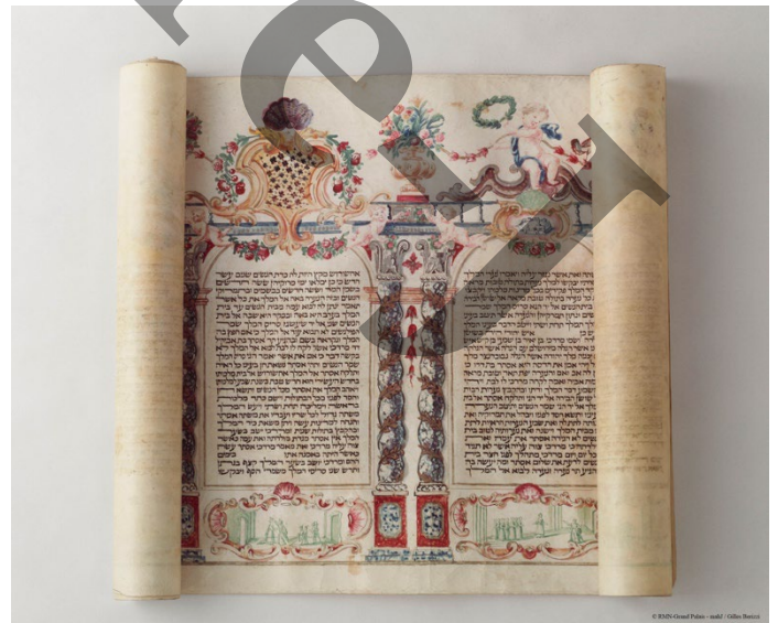
Document 3 : Meguila italienne du 18e siècle