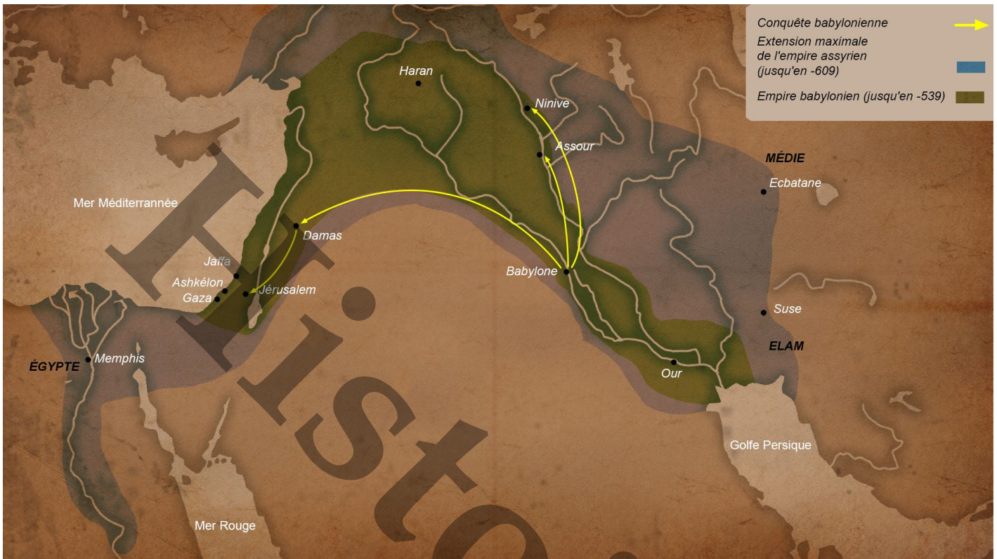
Document 1 : Carte de la Mésopotamie au -Ve siècle.