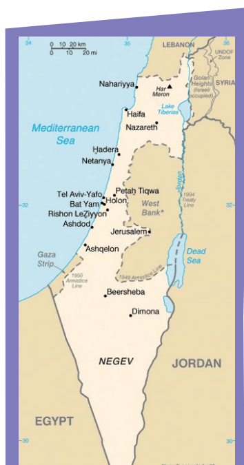
frontières d'Israël en 1948.

d'Israël avec les Palestiniens, ainsi qu'avec ses autres voisins. Cette situation est tangible avec l'actuelle guerre des « Glaives de Fer », qui se déroule principalement à la frontière sud-ouest dans la bande de Gaza.