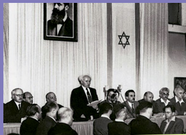
Ben-Gurion déclare l'indépendance d'Israël le 14 mai 1948.

Dans sa Déclaration d'Indépendance, Israël n'a pas précisé quelles étaient ses frontières. Ces dernières ont été définies progressivement, au fil des ans.