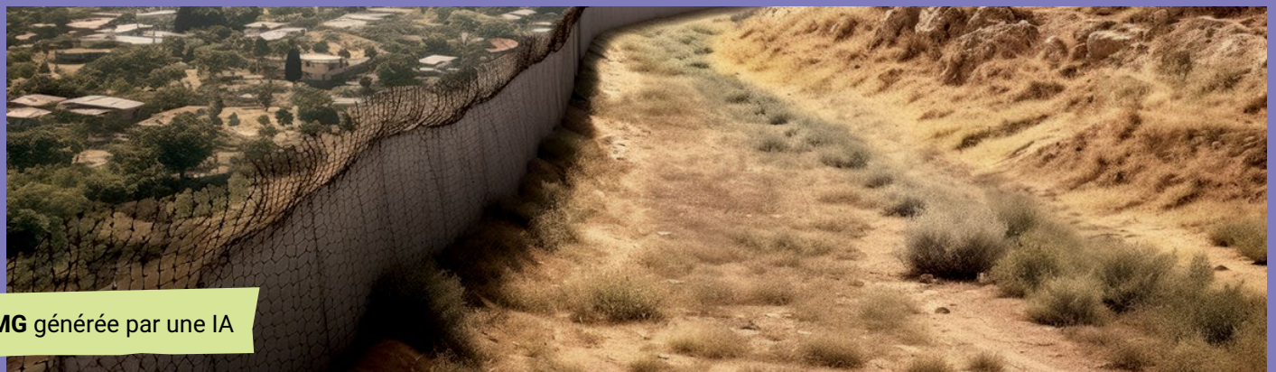
IMG générée par une IA

Israël a des frontières naturelles, comme la mer Méditerranée, qui constitue la frontière ouest de l'État. Mais Israël a également des frontières politiques avec ses pays voisins : la Jordanie, le Liban, la Syrie, et l'Égypte.