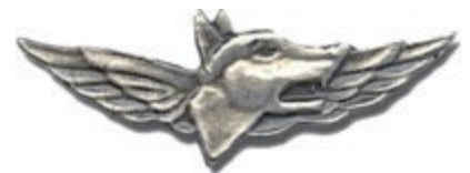
Insigne de l'unité