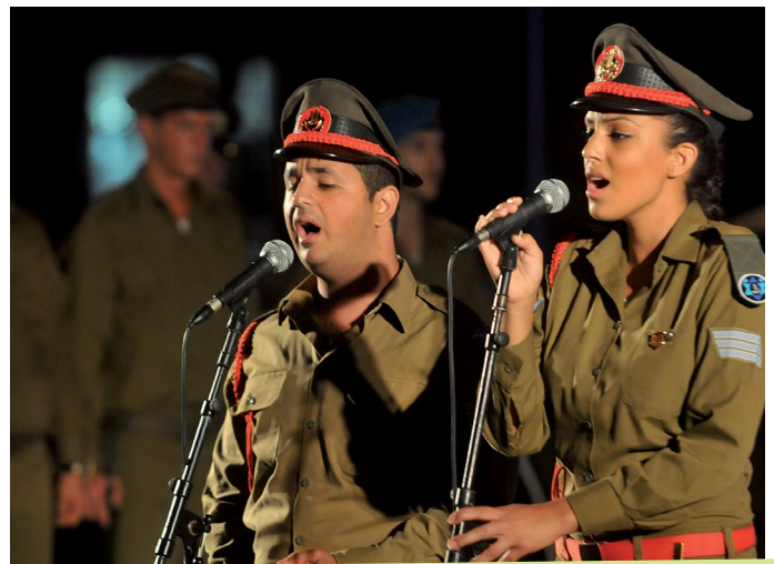
IMG FLICKR //Chorale militaire de Tsahal 2011.

(Pour eux, le service militaire n'est pas obligatoire, mais bénévole).