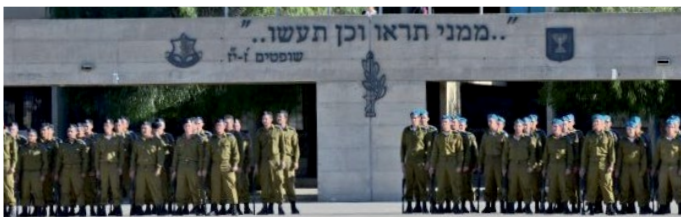
IMG La directive « מִמְנֵי תִּרְאוּ וְכֵן תַּעֲשׂוּ », à un emplacement central de l'école de formation des officiers de Tsahal.

C'est ainsi que les officiers d'aujourd'hui acquièrent les valeurs fondamentales de l'exemple personnel et du leadership, en s'inspirant du commandant qui a dirigé le peuple d'Israël il y a des milliers d'années.