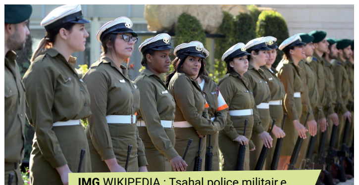
Tsahal police militaire

L'armée est une composante importante de l'identité israélienne. Elle joue un rôle essentiel dans la création de liens au sein de la nation, et constitue un pont entre les différentes cultures du pays.