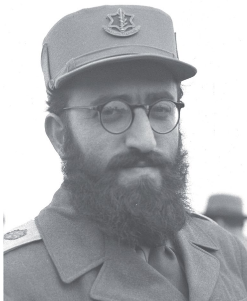
Rabin Shlomo Goren, premier rabin militaire au sein de Tsahal.

Il existe des parcours différents et variés pour effectuer le service militaire, dont certains sont adaptés aux étudiants de Yechiva.