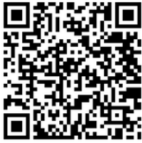
אותיות הסתיו אריאלה סביר