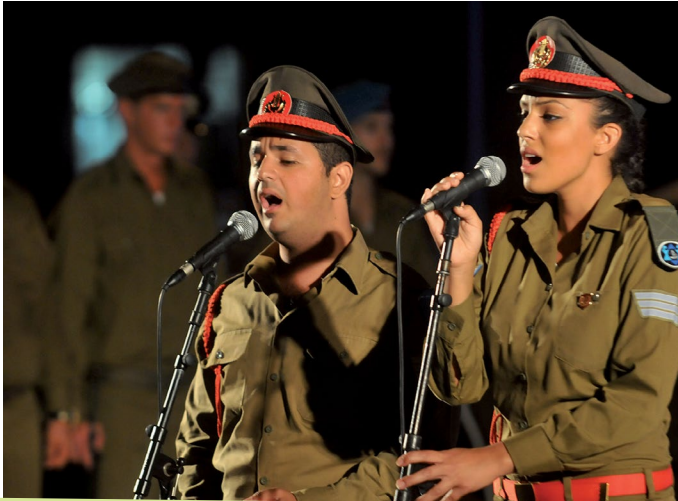
חיילים זמרים בלהקה צבאית

וכיום ישנם אפילו בחורים ובחורות בעלי צרכים מיוחדים, ו/או בעלי נכויות שיכולים לתרום את חלקם ולהיות חלק מצבא העם. (עבורם השירות אינו חובה, אלא התנדבות).