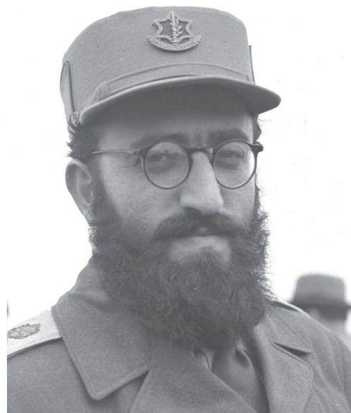
IMG: ויקיפדיה רב שלמה גורן, הרב הצבאי הראשון בצהל (GPO)