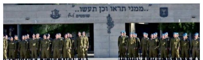
IMG «ממני תראו וכן תעשו» במיקום מרכזי בבסיס ההדרכה לקצינים של צה"ל.

האם גם אתם נותנים דוגמא אישית לאחרים? לחברים? לאחים? שתפו וספרו איך ובמה אתם יכולים לתת דוגמא אישית.