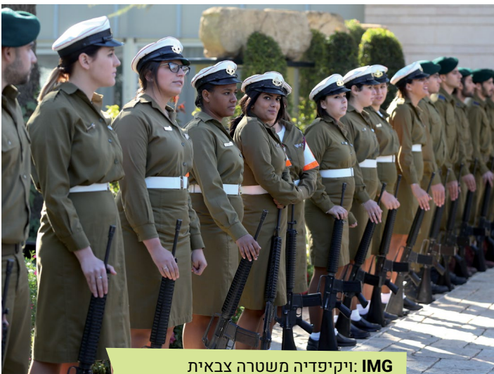
IMG: ויקיפדיה משטרה צבאית

ליצירת חיבור בעם ולגשר בין התרבויות הישראליות השונות.